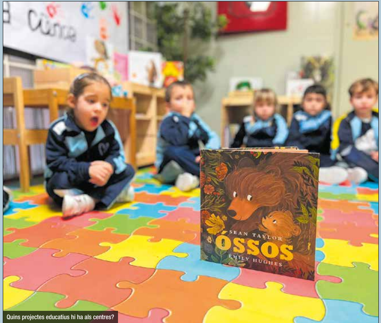
Quins projectes educatius hi ha als centres?

-Com es gestiona l'educació emocional i els valors? Pregunteu si s'aborden temes com l'assetjament escolar o l'educació en