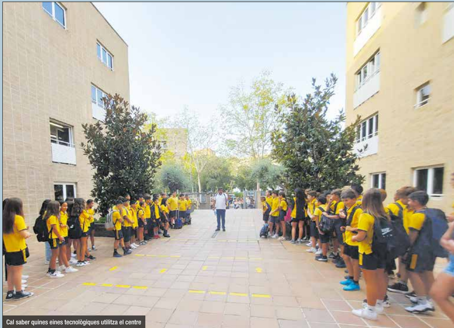
Cal saber quines eines tecnològiques utilitza el centre