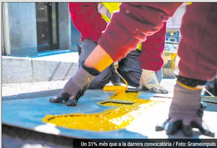
Un 31% més que a la darrera convocatòria

Les actuacions en matèria d'ocupació i formació arribaran a 1186 aturats i aturades