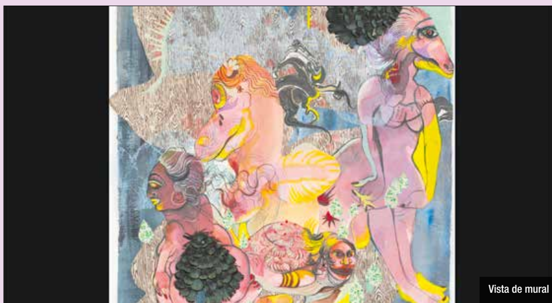
Vista de mural

ses. Aquest mural no només embellirà l'entorn, sinó que també servirà per donar veu a les històries i experiències de les dones de Sant Adrià, promovent-ne la visibilitat i la rellevància. El projecte es realitzarà al Casal de Dalt de la Vila entre els mesos de gener i març de l'any vinent. Les sessions gratuïtes seran els dimarts 21 de gener i 11 de febrer de 2025 a les 18 h. L'obra col·lectiva es presentarà al MhIC el proper 11 de març, com a esdeveniment integrat dins els actes del Dia Internacional de les Dones.