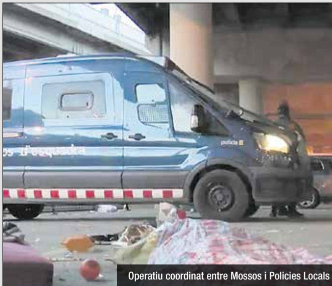
Operatiu coordinat entre Mossos i Polícies Locals

Un dispositiu conjunt entre la Policia Local de Sant Adrià, els Mossos d'Esquadra, la Guàrdia Urbana de Badalona i la Policia Nacional s'ha desplegat sota el viaducte de la C-31 amb l'objectiu de frenar l'activitat del conegut 'Mercat de la Misèria'. Aquest mercat ambulat il·legal, que cada setmana concentra uns 300 venedors, es caracteritza per oferir productes de dubtosa qualitat i provinents, en molts casos, de les escombraries. A més del desplegament policial, els serveis de neteja de Sant Adrià de Besòs i de Badalona han col·laborat en el dispositiu per garantir la retirada del material requisat. Durant la jornada, s'han recollit fins a 5.000 kg de productes.