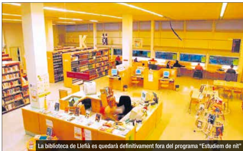
La biblioteca de Llefià es quedarà definitivament fora del programa "Estudiem de nit"

2023 es completen les obres estructurals perquè aquest nou equipament cultural tingui accés directe des del carrer del Mar. Sens dubte, la seva entrada en servei dinamitzaria el seu comerç local. Tot estava a punt, diu ERC, des de Badalona Cultura, perquè a finals del 2023 la proposta es pogués inaugurar. Però el govern del PP l'ha aturat, assegura. Amb un aforament de 50 persones assegudes i 100 a peu dret, es va dissenyar per enriquir l'oferta escènica per a acollir esdeveniments de petit format com monòlegs, microteatre, petits concerts.