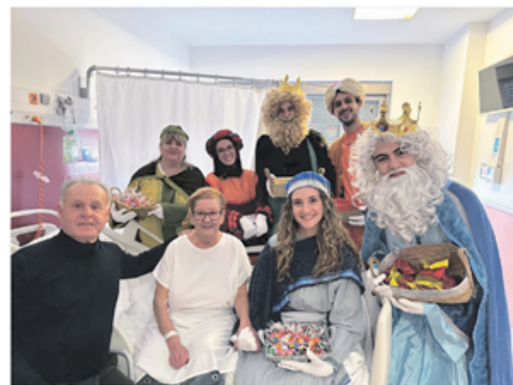
Els Reis d'Orient visitant a una pacient.

El passat 5 de gener, Ses Majestats els Reis d'Orient van visitar l'Hospital de l'Esperit Sant, on van compartir una estona amb els pacients i els seus acompanyants.