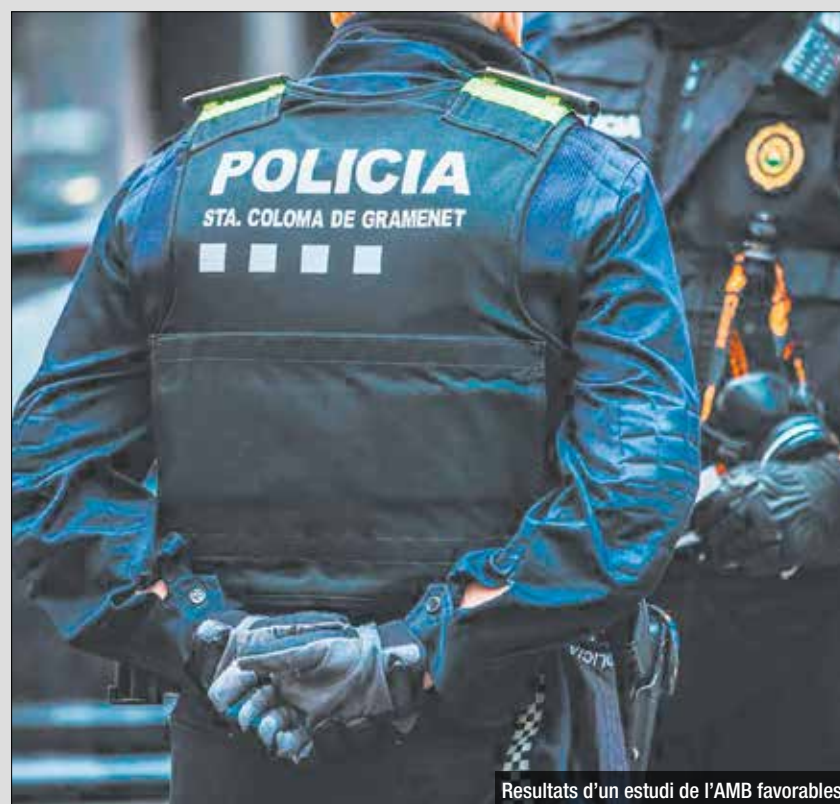
Resultats d'un estudi de l'AMB favorables

mitjana metropolitana, que se situa en el 26%. Aquesta dada reforça la posició de la ciutat com un dels municipis