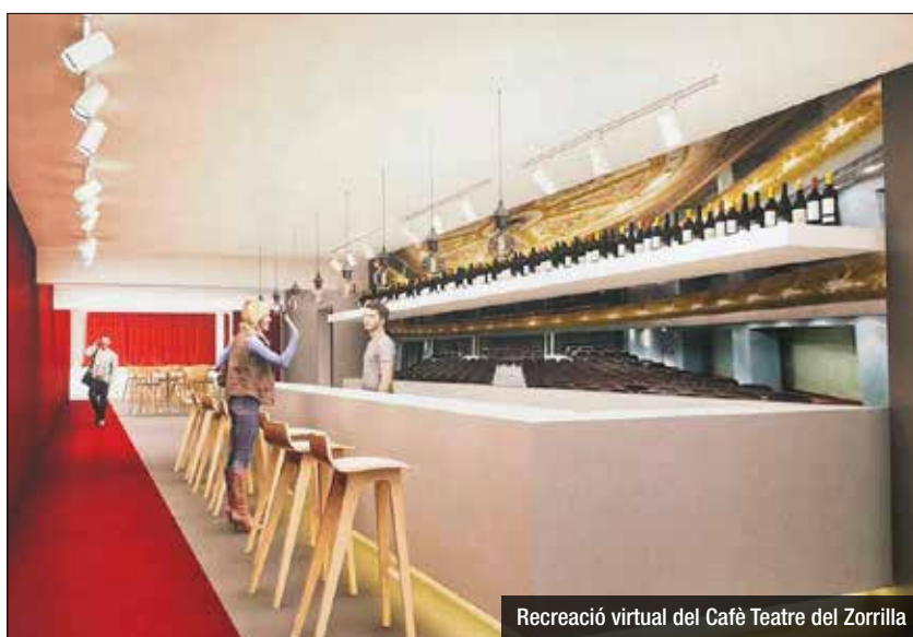
Recreació virtual del Cafè Teatre del Zorrilla