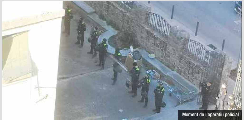
Moment de l'operatiu policial

sodis d'incivisme i inseguretat a la zona que no s'han resolt del tot. Ja que part dels desallotjats es van traslladar a una nau al carrer Corderos gestionada també per aquest grup, propietat del Banc Santander que seria la pròxima desocupació agendada.