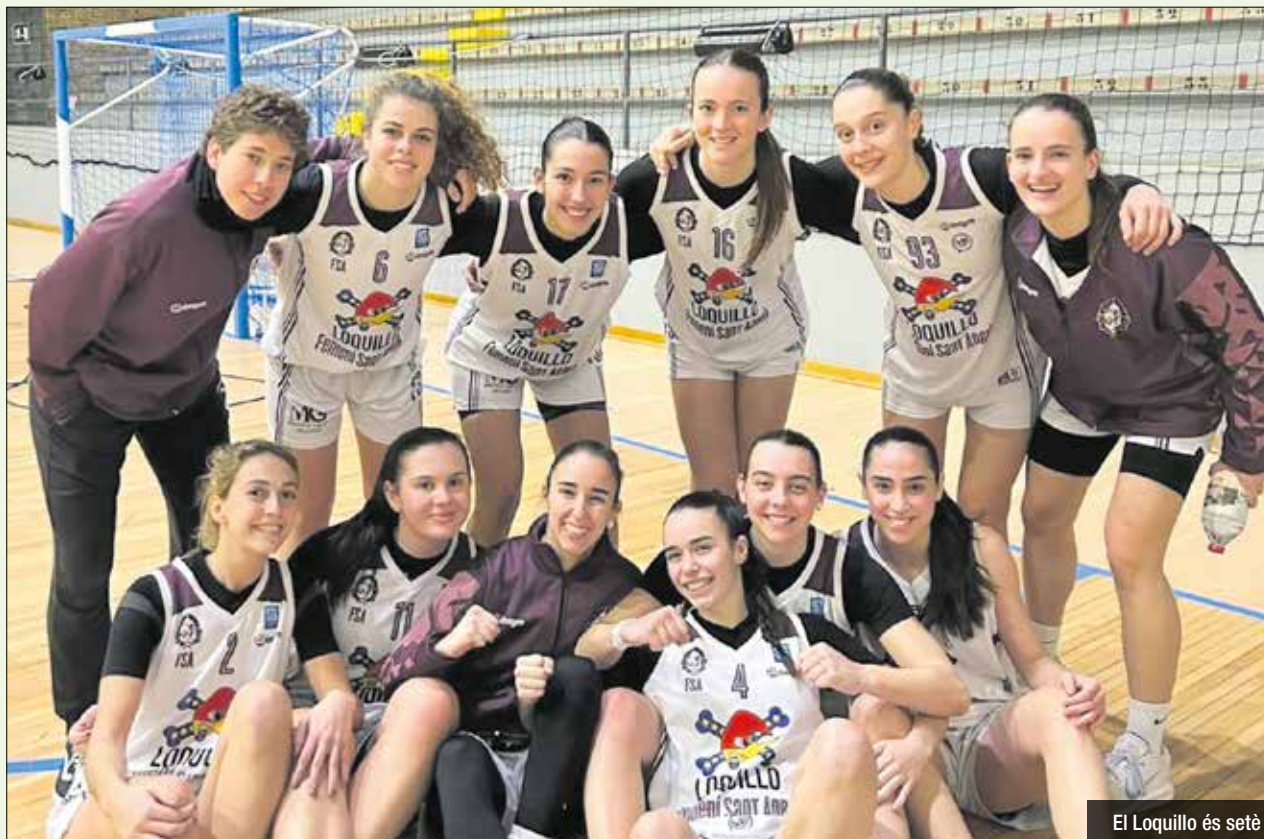
El Loquillo és setè