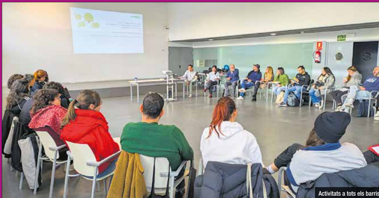
Activitats a tots els barris

L'objectiu principal és enfortir el treball comunitari i educatiu al barri, de cara al futur