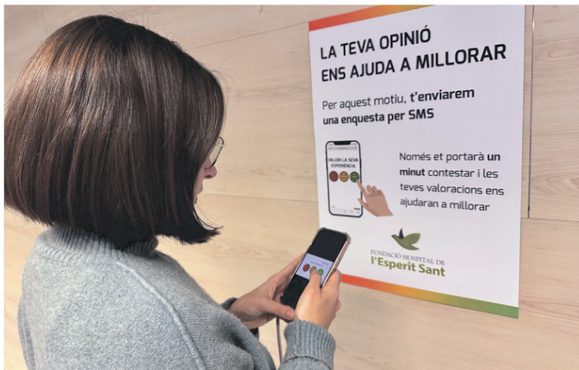
Una pacient realitzant l'enquesta rebuda per SMS.

La Fundació Hospital de l'Esperit Sant va posar en marxa enquestes de satisfacció per conèixer l'opinió sobre l'experiència dels pacients que han estat intervinguts quirúrgicament. Mitjançant un SMS que els usuaris rebran 48 hores després de l'alta, podran accedir a una enquesta digital des del seu telèfon i respondre a un seguit de preguntes molt curtes i visuals.