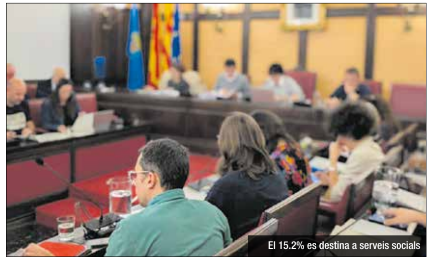
El 15.2% es destina a serveis socials

neteja de l'espai públic (vies, places, parcs i edificis) i les actuacions fitosanitàries de lluita contra les plagues, més els 2 milions que s'assignen al manteniment de la via pública. Les actuacions en polítiques educatives són de les que augmenten respecte a l'any anterior. Es destinaran més de 4,5 milions d'euros a la gestió del servei municipal d'escoles bressol, actualment amb 9 centres, mitjançant la societat municipal Bressolgramenet SA. Amb aquesta dotació es garanteix el servei municipal incloent la part del cost no subvencionada per la Generalitat de Catalunya com és la parella educativa. En aquesta àrea es gestionen els programes de planificació educativa per import de quasi un milió d'euros; concretament, el programa de reutilització de llibres