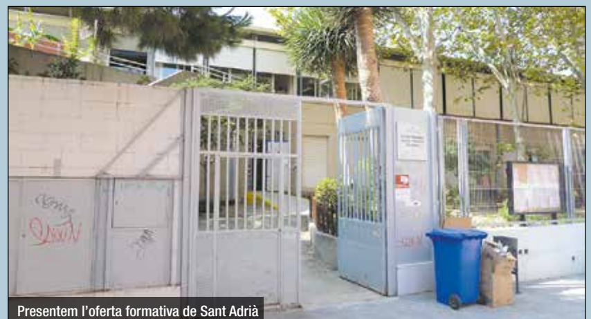
Presentem l'oferta formativa de Sant Adrià

Sant Adrià ofereix un ventall educatiu que abasta totes les etapes, incloent-hi formació d'adults